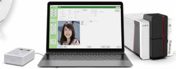
「ウラカタチケット」